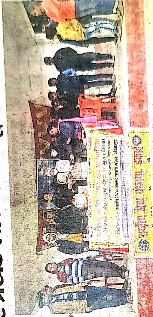
आदर्श कॉलेज में जयंती समारोह उद्घाटन करते अतिथि।