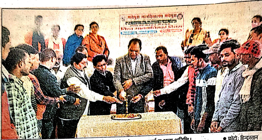
मधेपुरा कॉलेज में कार्यक्रम का शुभारंभ करते मधेपुरा कॉलेज के प्राधानाचार्य व अन्य अतिथि।